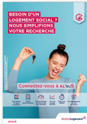
Affiches (Proposées en A4-A3-A2)