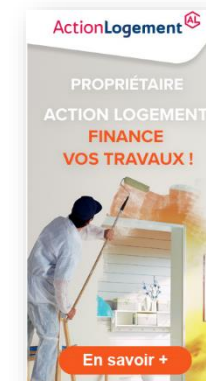
Bannières web (déclinables en plusieurs formats pour votre intranet)