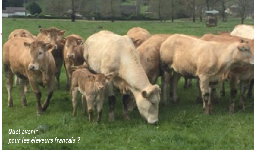
Quel avenir pour les éleveurs français ?